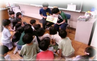
図書委員が全学級に読み聞かせをしました。

いる私たちの「さらにもっとよくしていこう」と母校を思う気持ちが濃くなり、それが、後輩たちにつながっていきます。「年は重ねてもいつまでも活力が湧いている学校、そのような学校になっていくのだろうな」と今回の代表委員や一生懸命に取り組む児童の姿を見て、笑顔で体育館を後にしました。