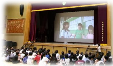
1, 2年生「清明小の自慢」紹介

1, 2年生は、自分たちで見つけた清明小学校のよいところをテレビ番組形式で発表。3, 4年生は、清明小に関する出来事等をクイズにして発表。5, 6年生は、ダンスを入れながら清明小の紹介番組を生放送形式で発表。代表委員は、清明小〇×クイズで発表。クイズや歌を通して清明小学校の魅力や歴史、自然を発表しました。